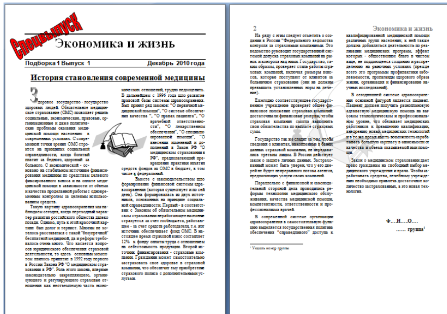
Рисунок 3 - Пример оформления задания

Оформить документ профессиональной направленности в виде журнальной или газетной статьи с созданием колонок, колонтитулов и содержанием графических объектов. Образец оформления представлен в примере рисунке 3.